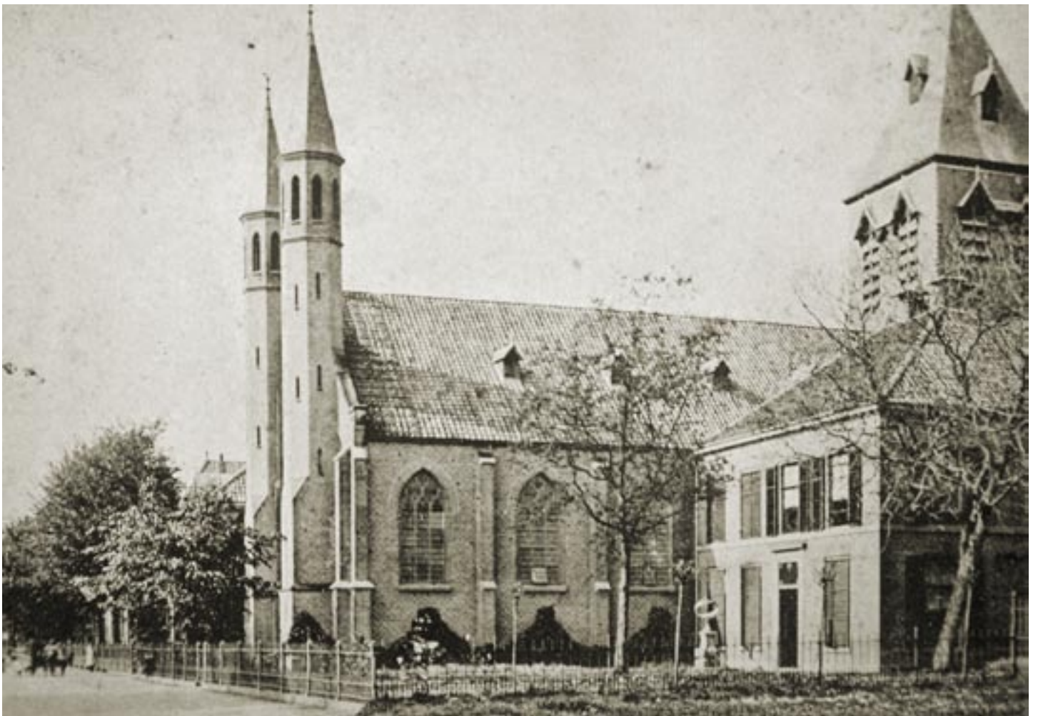
St. Hiëronymuskerk Wognum