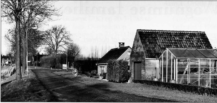
De ienigste overgeblevene van de acht, anno 2000. Het laatste huisje (bewoner/eigenaar Jaap Koppes) is gemoderniseerd, met garage en hobbykas.