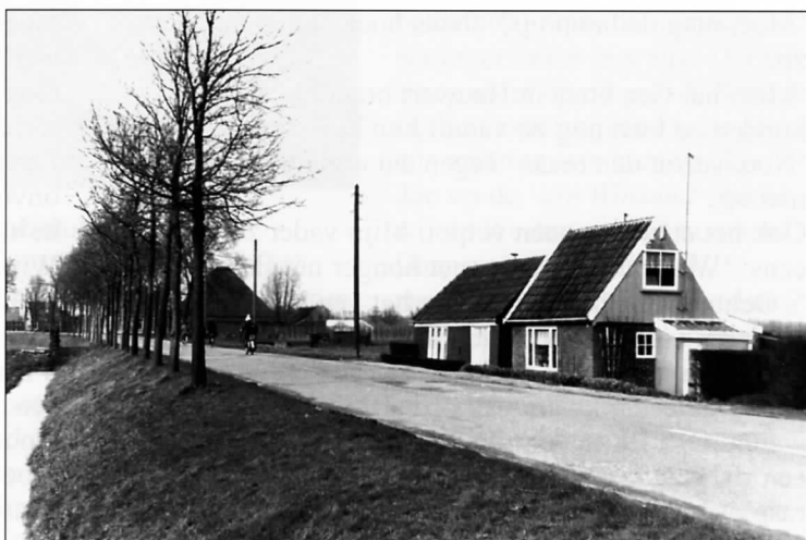
Twee van de acht omstreeks 1964

Al liep je rechtdeur in 't achterendje, den had je deer de kamerdeur. In de voorgevel zat in de kamer ien raam, 't was een negenruiter. Teugen die achterwand had je twei bedstees met onderkooie. Deer bewaarde opoe de eerepele in, urte, bône en inmaakflesse met