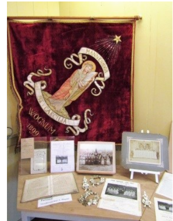
Het vaandel van het mannenkoor Sint Caecilia met daarvoor portretten van de Wognummers