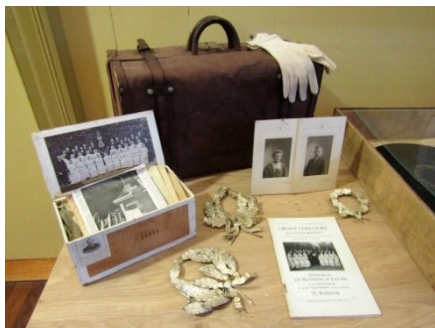
Een indruk van de expositie

Daarnaast wordt een sprong gemaakt naar 2018. Alle koren die er dit jaar zijn in Nibbixwoud, Wognum en Zwaagdijk-West willen we in het zonnetje zetten.