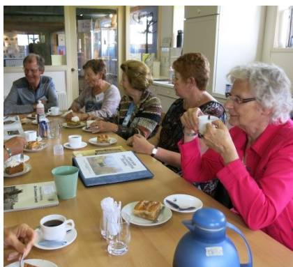
Een groep bezoekt het Huis van Oud. Eerst is er koffie en appeltaart.

Informatie over of aanmelden voor al dit vrijwilligerswerk: Ina Broekhuizen, 0229 572159.