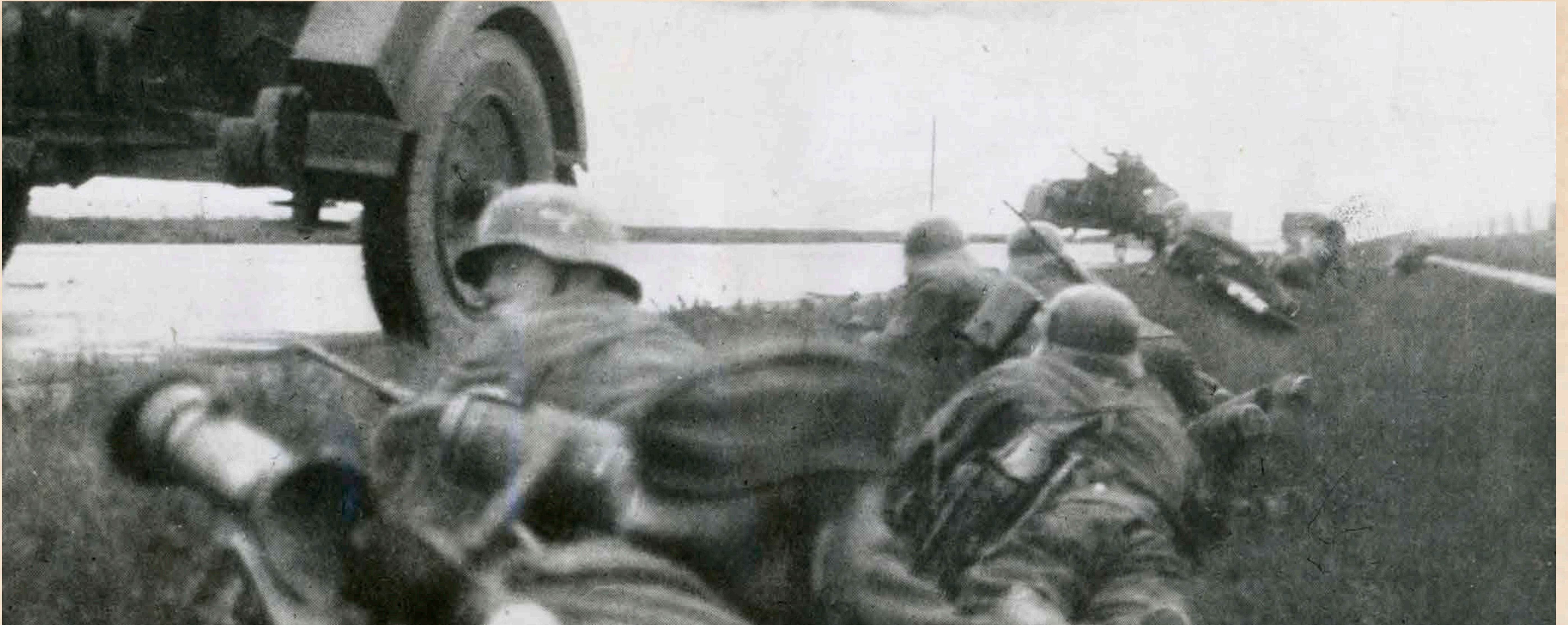
De bezetter schiet niet op bij Kornwerderzand., er was hevig verzet door de Binnenlandse Stijdkrachten.