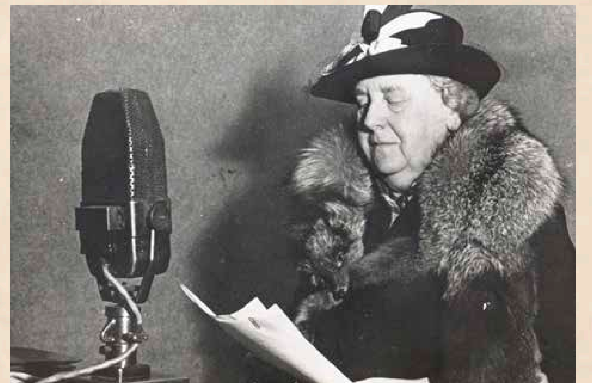
Wilhelmina met een proclamatie tot het Nederlandse volk.

Zij pakken fietsen af en trappen naar Hoorn. West-Friesland is bezet.