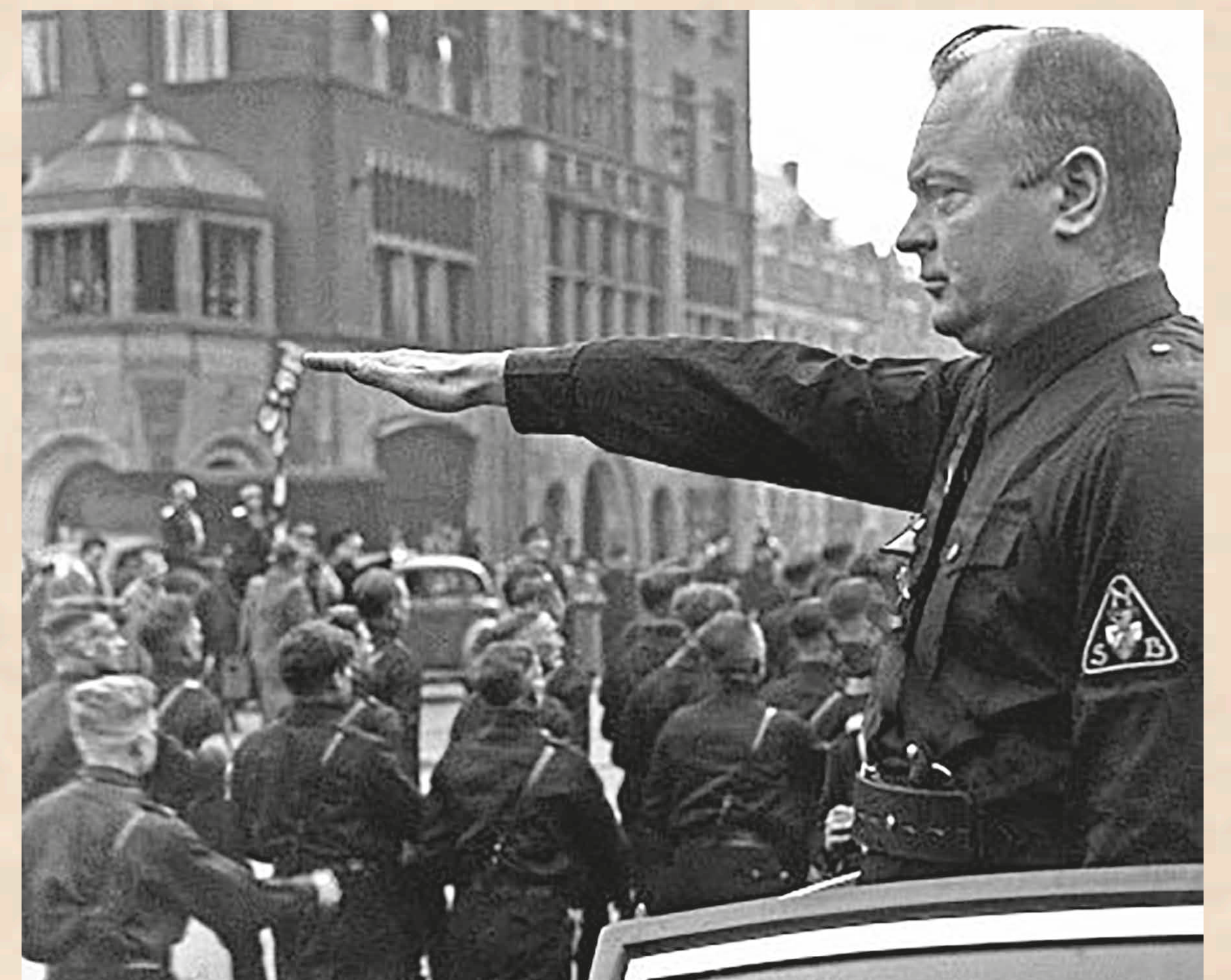
Mussert groet de NSB parade.

gebeurt. Het wordt een hardvochtige wurggreep, eentje die verzet oproept. Dat verzet komt er. En er komt ook een veilig thuis voor mensen die uit beeld moeten verdwijnen, de onderduikers. 75 jaar na de bevrijding is vrijheid normaal geworden. Behalve voor mensen die nog steeds moeten vluchten voor oorlog of onrecht. Zij wonen hier ook. Misschien wel omdat er veel West-Friezen zijn, die nog weten hoe klein het verschil is tussen vrijheid en vluchten.