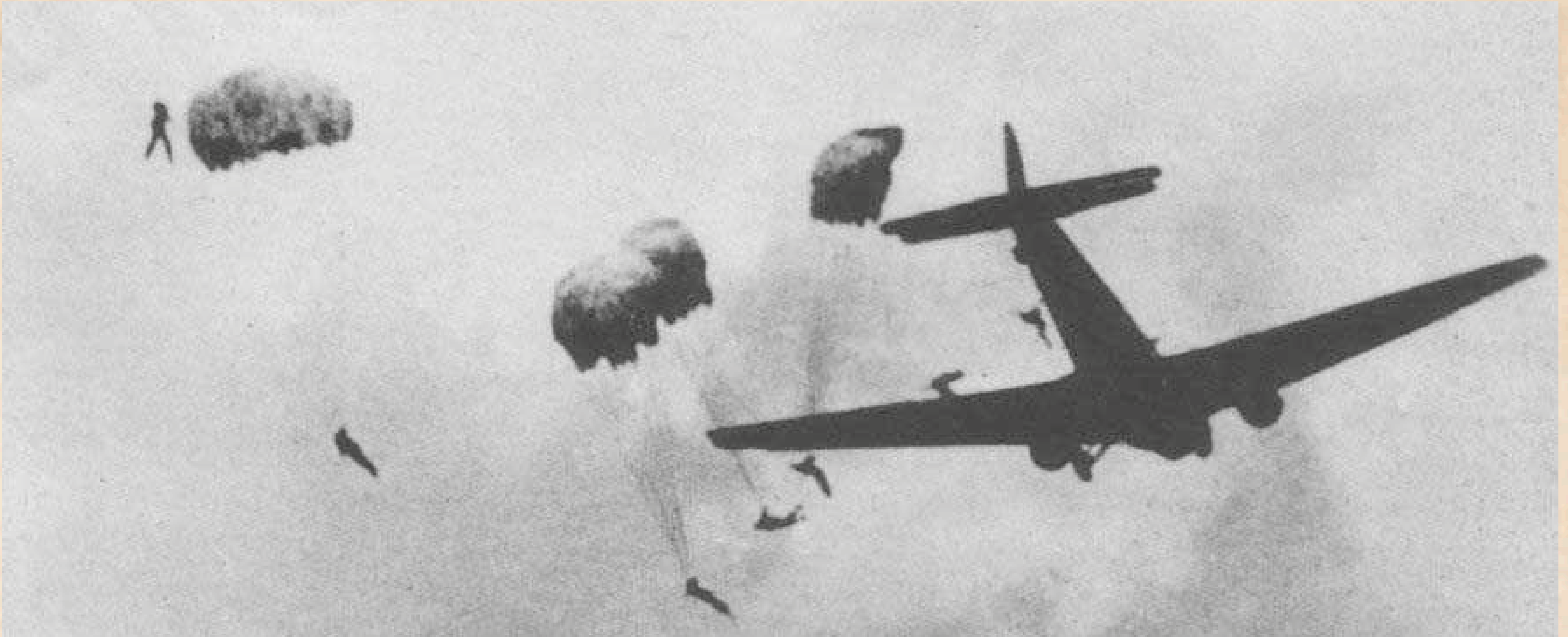
Duitse Fallschirmjäger springen boven Rotterdam, mei 1940.