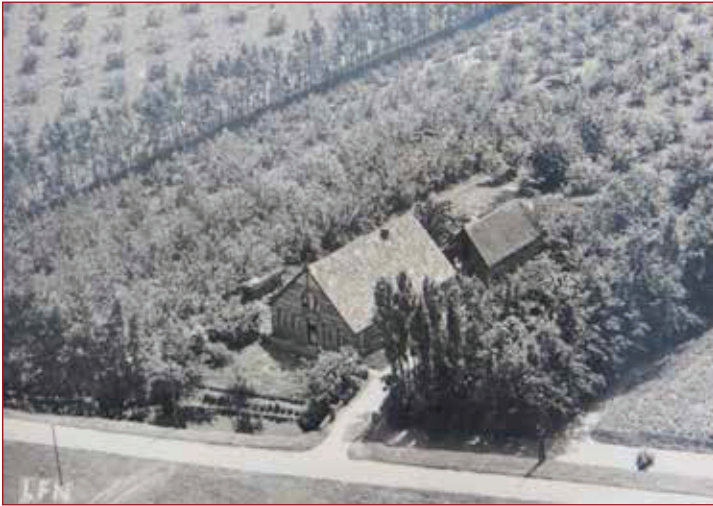
Huis en tuin van de familie Smit aan de Grote Zomerdijk.

Na de ruilverkaveling, eind jaren tachtig van de vorige eeuw, is de molen buiten gebruik gezet en in verval geraakt. Wist u overigens dat de kop waaraan de wieken gemonteerd zijn en waarop de molen rond kan draaien het cardan is van een oude A-Ford? De schuiven onder in de betonnen bak van de molen kunnen zo ingesteld worden dat de molen water uit de sloot kan afvoeren maar ook water in de sloot kan pompen. Door een vlotter, die met het waterpeil omhoog of omlaag gaat, worden de borden die achter de wieken zitten zo gedraaid dat de kop van de molen in dan wel uit de wind draait. Als de sloot leeggepompt is, draait hij zijn kop uit de wind en zal de molen stil vallen. Bij een stijgend waterpeil zal de kop weer in de wind draaien en de draad weer oppakken.