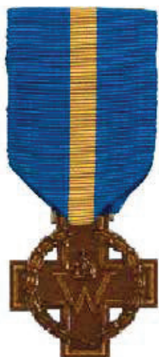
Kruis van Verdienste - model 1941.

cies weet wat er in het verleden is gebeurd en wat er tot de breuk in de familie heeft geleid. Maar we zijn een paar generaties verder en er zijn, hoewel de behoefte niet overal even groot is, weer de nodige contacten gelegd en gegevens uitgewisseld. En voor mij is dit -zeventig jaar na WO II - in ieder geval dé gelegenheid om deze vergeten Wog-numer alsnog de eer te gunnen die hem toekomt.