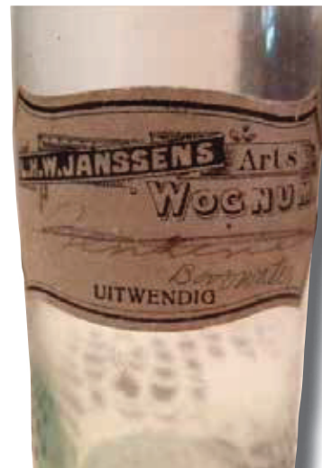
Boorwaterfles.