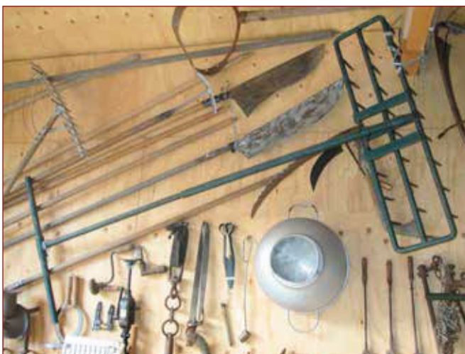
Een deel van de verzameling.

Ik werkte daar als hovenier en deed ook het onderhoud van de volière. Zo'n drie jaar later werd ik beheerder van de kinderboerderij aan het Keern. Fantastisch werk met allerlei verschillende dieren en met leuke mensen die vanwege hun beperking daar werkten, ieder met zijn eigen zorgbehoefte. Voor mij een gouden tijd om hier leiding te mogen geven.'