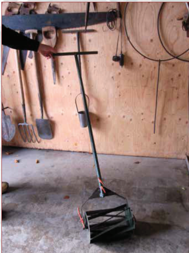
Rolschoffel uit 1955.

Samen met mijn vrouw geniet ik erg van mijn pensioen. We zitten zelfs op dansles. Wel heb ik ervoor gezorgd dat mijn verzameling in goede handen komt als ik er niet meer mocht zijn. Het zou jammer zijn als het verloren gaat. Maar ik hoop toch echt dat dit nog heel lang mag duren.'