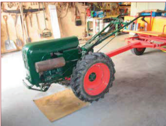
De Holder uit 1960.