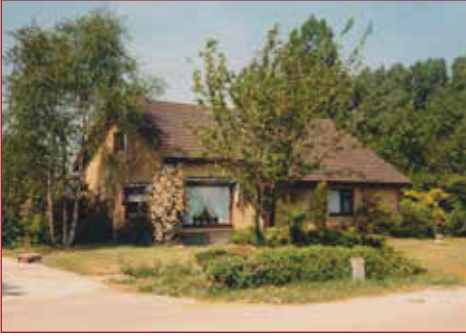
Kerkweg 26, gesloopt in 2012.