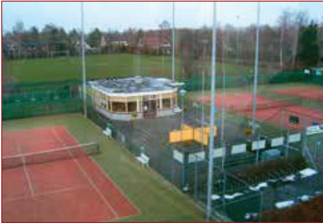
Tennisbanen en bijbehorende kantine van Tennisvereniging Wognum.