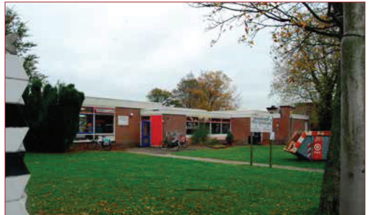
De oude Mariaschool aan de Ganker 3a in Nibbixwoud. Gebruikers waren kinderdagverblijf Estro (Villa Kakelbont) en jongerenclub Backfire.