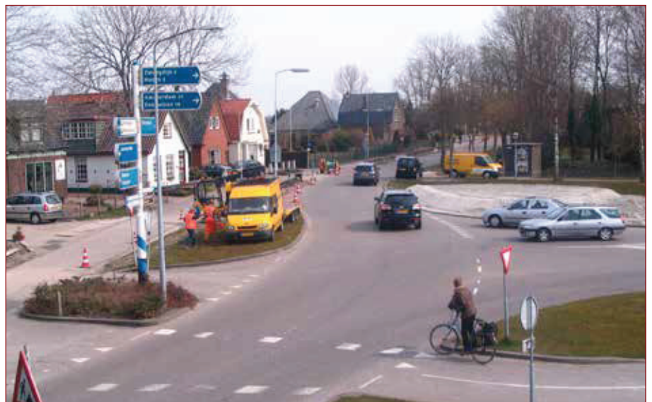
Het kruispunt Hoornseweg – Oosteinderweg, Wognum.