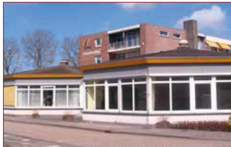
De koepels van Sweelinckhof, Wognum.