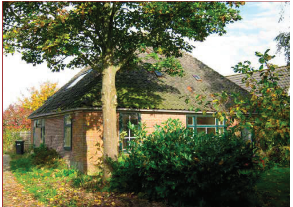
Oosterwijzend 29, Nibbixwoud.