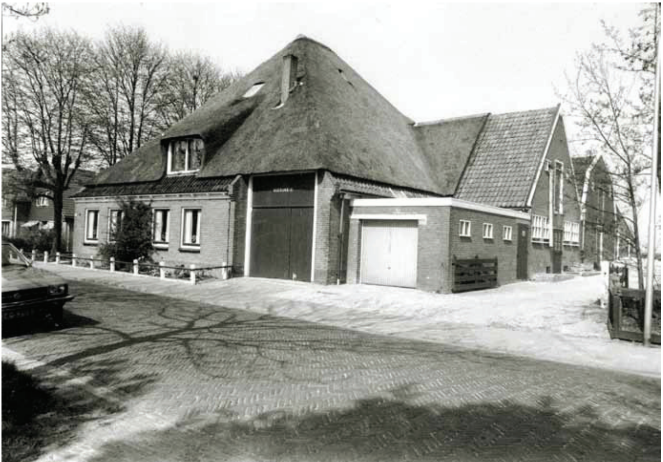
De Nuboxhoeve aan de Dorpsstraat.

Wanneer vroeger op een boerderij mond-en-klauwzeer uitbrak, maakte gewoonlijk een bedrukt plakkaat voor bij de weg duidelijk dat men met een besmet terrein te maken had. Bezoek werd dan niet op prijs gesteld. De koeien werden, zij het niet allemaal, behoorlijk ziek en de melkproductie vloog achteruit. Op een dag werd Theo uitgenodigd om op een proefboerderij te komen waar geëxperimenteerd werd met een vaccin tegen MKZ. Ondanks ernstige twijfels - zou hij zelf niet besmet worden? - liet hij zich overhalen. Van top tot teen zo veel mogelijk afgeschermd wandelde Theo langs twee groepen koeien, waarvan de ene groep wel, de andere niet was ingeënt. De niet-ingeënte groep was in zijn geheel besmet. De ingeënte dieren waren niet ziek. Thuisgekomen kleepte Theo zich eerst voor alle zekerheid helemaal uit en ging onder de kraan staan. Toen in 1949 gevraagd werd om bij wijze van proef de koeien op het bedrijf tegen MKZ in te enten, werd na veel twijfels besloten om zeventig dieren in te enten. Er trad dat jaar inderdaad MKZ op, maar het was geen zware epidemie. Op het bedrijf van Theo werd geen koe ziek.