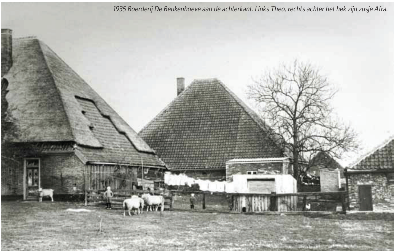
1935 Boerderij De Beukenhoeve aan de achterkant. Links Theo, rechts achter het hek zijn zusje Afra.

Theo Ruyter, geboren op 7 september 1925, groeide op aan de Dorpsstraat in Nibbixwoud, eerst op een oude stolpboerderij, die later veranderde in de 'Nuboxhoeve' en daarna, Theo was toen 4 jaar oud, op de Beukenhoeve, de boerderij tegenover de Cunerakerk. Zijn vader, Dirk Ruyter, had die boerderij, bestaande uit twee stolpen, erbij gekocht. Dirk Ruyter had, wat Theo noemt, een 'all-in' gemengd bedrijf. Hij had vee, koeien, schapen en varkens, en verbouwde ook tulpenbollen. Theo was al jong actief op het bedrijf: hij hielp bij het koeien en schapen verweiden en bollen pellen. Schapen had vader Ruyter zelfs lopen op de Wieringermeerdijk.