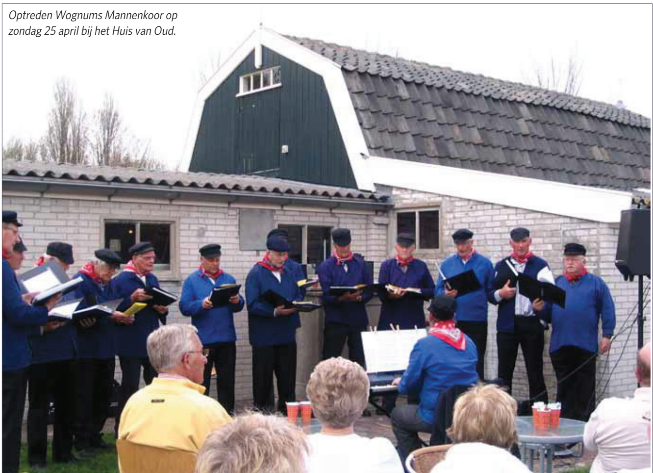
Optreden Wognums Mannenkoor op zondag 25 april bij het Huis van Oud.